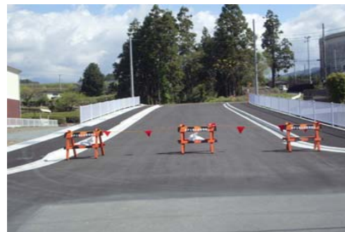
12M-1号線街路築造工事